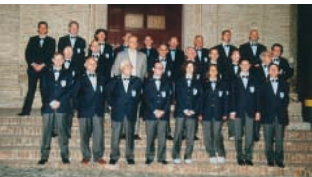
Banda musicale "Città di Montefano"

La banda musicale "città di Montefano" ed il coro Oddo Marconi costituiscono l'associazione musicale in oggetto.