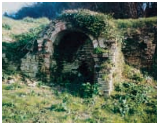
Fonte di Carradori