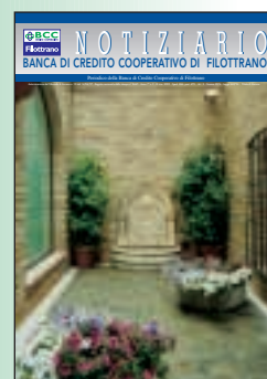
Banca di Credito Cooperativo di Filottrano Notizie