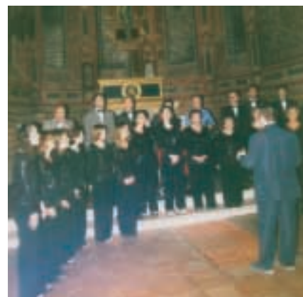
Coro "Oddo Marconi"

Altre importanti attività dell'associazione musicale