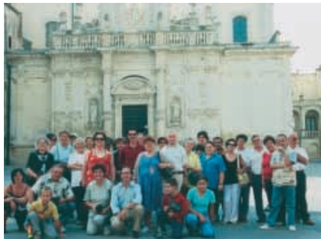
Foto a Lecce