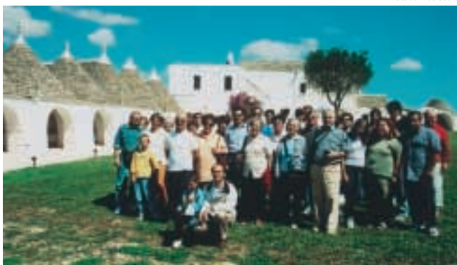
Foto ad Alberobello

Vi assicuro che il gruppo che ha partecipato è senz'altro rimasto affascinato dai "Colori", e non è certo rimasto deluso dai "Sapori".